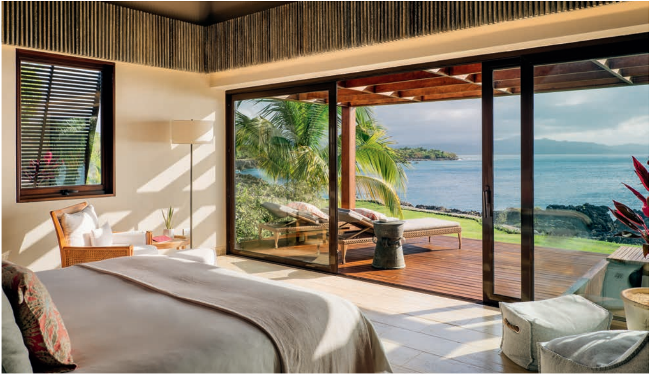
多米尼加共和国安颐 ANI Dominican Republic 度假村内部及餐饮