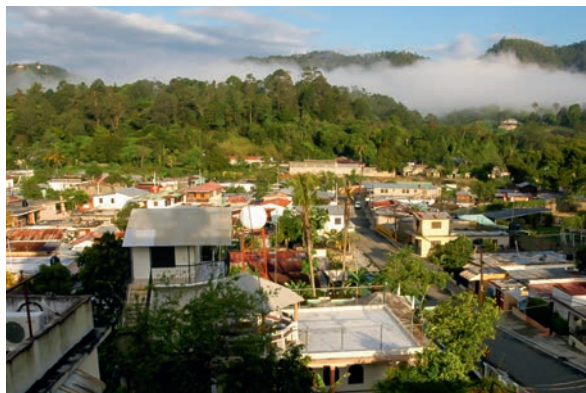
多米尼加的海滩、湿地、殖民时期风格的老城、村庄。

你可以粗略地把多米尼加分成三部分，南、中、北。南部，蓬塔卡纳地区，你会发现许多酒店，这也是该国作为旅游目的地而闻名的地方，南海岸沿岸还有圣多明各，一座富有活力的小城，拥有典雅的古老城区，这里历史悠久，涌现出许多精致的餐厅和酒吧；往中部走，是山脉、咖啡和烟草种植园的地界，许多人会给自己的旅途添上一站可种植园和巧克力工厂之旅；北部自然美景尤为引人注目，原始且未被商业化，这里坐拥加勒比海地区最美的海岸之一，其中风景秀丽的萨马纳其以12月到次年4月的鲸鱼繁殖季而闻名。对于这样一个丰盛的目的地，挑剔的旅行者不得不寻找到一个DMC（目的地管理公司），譬如Bonvidó，才能最快最好地融入当地：去喝最好的咖啡、享用最好的雪茄，畅饮加勒比地区最畅销的朗姆酒，以及预定那些只能通过好奇心和好朋友才能找到的餐厅。